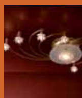
75.8307 pag. 19