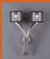
39.2293 pag. 51