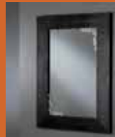
90.8412 pag. 54