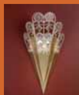
39.2555 pag. 20