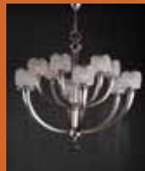
12.4492 "Nur" pag. 40