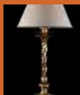
55.2650 pag. 12