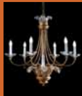
12.1227 pag. 6