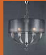
12.3494 "Nur" pag. 44