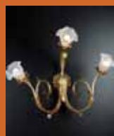
39.4198 pag. 13