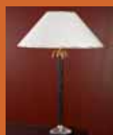
55.5583 pag. 24