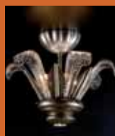
75.1225 pag. 9