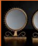
90.9888 pag. 15