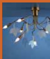
75.4110 pag. 49