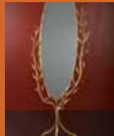
90.9363 pag. 36