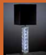
55.4880 pag. 53