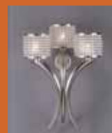
39.4493 pag. 50