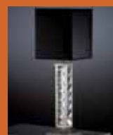
55.4980 pag. 52