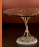
87.0669 pag. 27