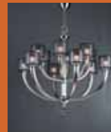
12.3492 "Nur" pag. 43