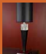
55.8444 pag. 22