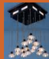
75.1240 "Bloom" pag. 46