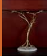
87.6667 pag. 28