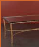
87.5880 pag. 33