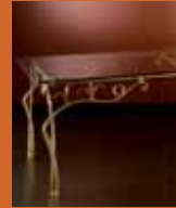
87.0368 pag. 29