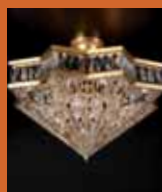
70.1360 pag. 10