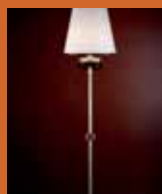
55.8855 "Oj" pag. 25