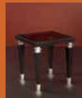
85.6163 pag. 35