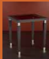
85.6164 pag. 35