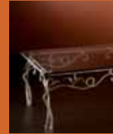
87.0363 pag. 30