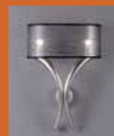
39.2292 pag. 51