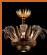
75.1226 pag. 8