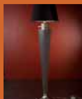
55.8440 pag. 23