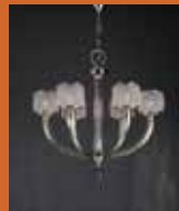
12.4491 "Nur" pag. 41