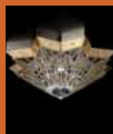
75.1364 pag. 10