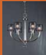
12.3493 "Nur" pag. 42