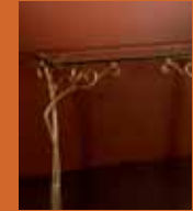
87.0367 pag. 32