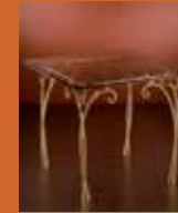
87.0364 pag. 31