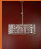
12.1366 pag. 18