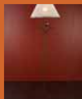
55.5515 pag. 25