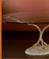
87.0668 pag. 26