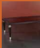
85.6160 pag. 34