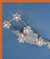
72.3123 pag. 48